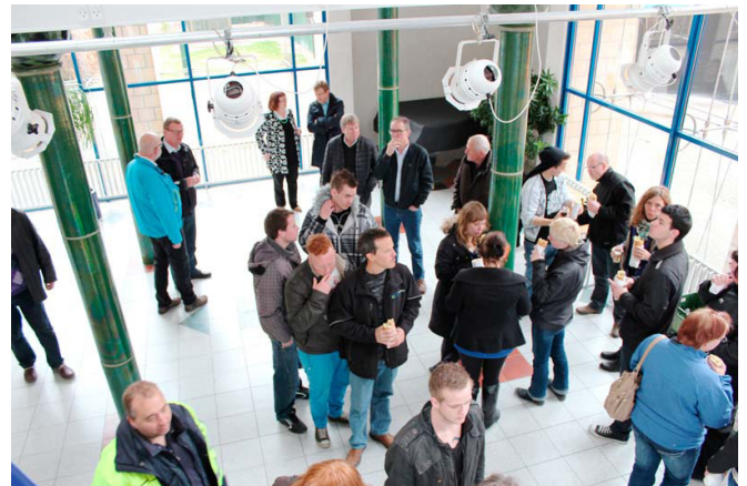
▲ De fremmødte samledes i musikhuset ved Aksel Møllers Have.